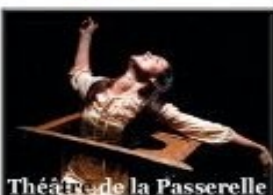
Théâtre de la Passerelle

Que feriez vous si votre meilleur ami, en plus de squatter votre vie, votre salon et votre brosse à dents, se chargeait de tout faire à votre place: dire tout haut ce que vous osez à peine murmurer, faire toujours ce que vous osez à peine imaginer... et tout ça sans que personne ne s'en rende compte! "Une comédie subtile, profonde. Les comédiens sont excellents" Figaroscope "Une comédie dans l'air du temps aux personnages vifs et déjantés. Drôlement bien interprétée. Rythme. Peps. Des comédiens modernes qui ont tous du chien" LeMoi.fr. "Très drôle, humour décalé, dialogues efficaces, bien rythmés, troupe énergique, répliques bien senties. Les rires sont au rendez-vous" Au-Théâtre.com