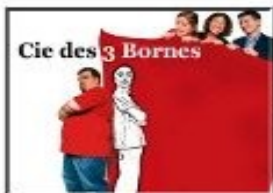
Cie des 3 Bornes