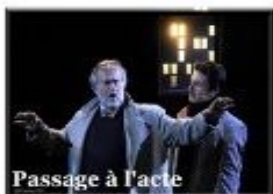
Passage à l'acte