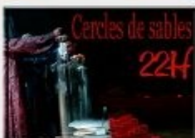
Cie des Ils et des Elles

Le spectateur se trouve totalement ébloui. Eblouissement, tel est finalement le seul terme qui convient. G. DEWULF Coup de Coeur RueduThéâtre. TIAN crée l'événement dans le Festival. La presse ne s'y est pas trompée qui va de louanges en diptyques pour évoquer la pièce. Un spectacle diablement vivant. TIAN déroule un tapis de frissons sous le cœur des spectateurs. F. BONNEUX La Provence. TIAN charge son rôle d'une émotion dense et communicative. Elle est superbe. Du grand Art. Coup de Coeur La Provence. Le spectacle est d'une somptuosité beauté. Le spectateur en ressort véritablement ébloui. G.A.D. coup de coeur du Dauphiné Vaucluse